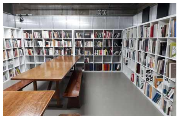
문화원 자료실 내부