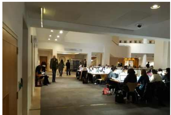
로비 내 열람좌석