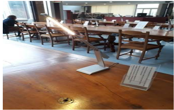
필사본 및 희귀본 자료 열람석