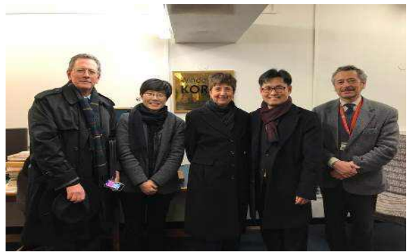
한국자료실 관계자들과 함께