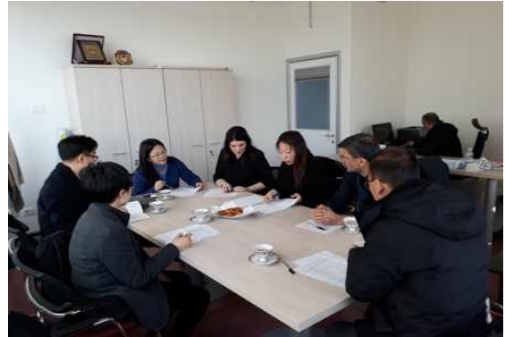
한국자료실 설치 관련 관계자 협의