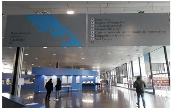
대표 컬러를 활용한 공간 구성