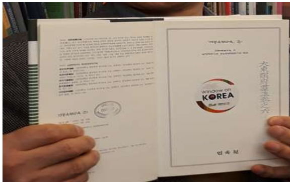
한국자료실 지원 자료