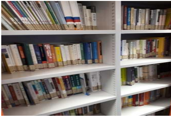
소장중인 한국관련 자료들